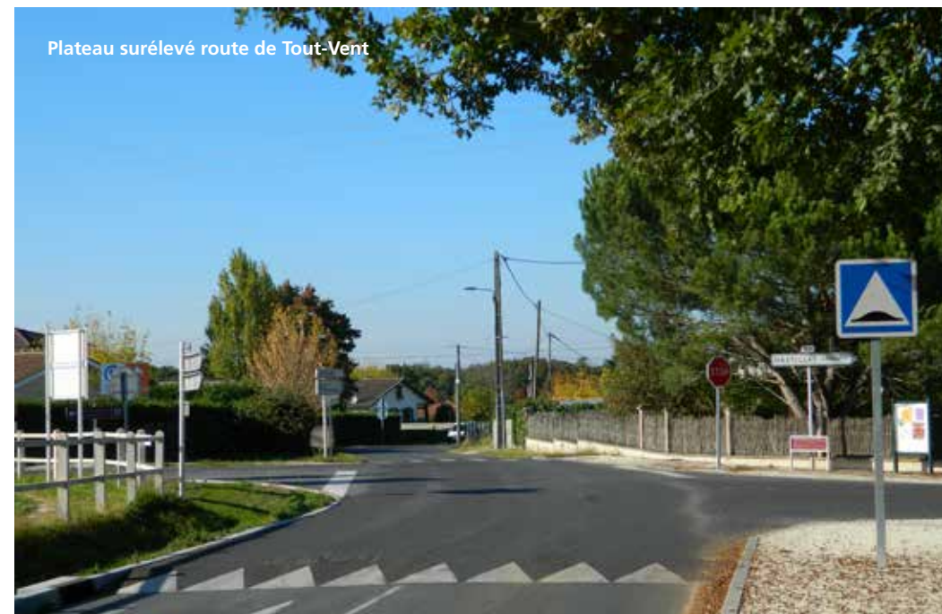
Plateau surélevé route de Tout-Vent