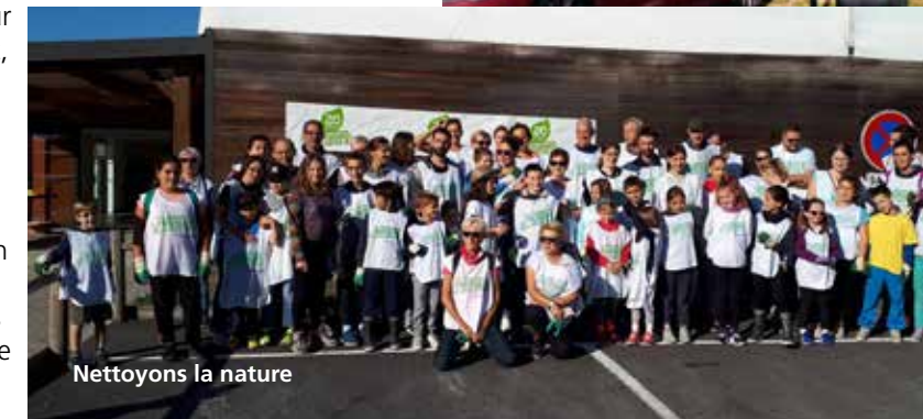
Nettoyons la nature