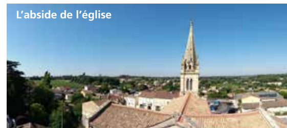
L'abside de l'église