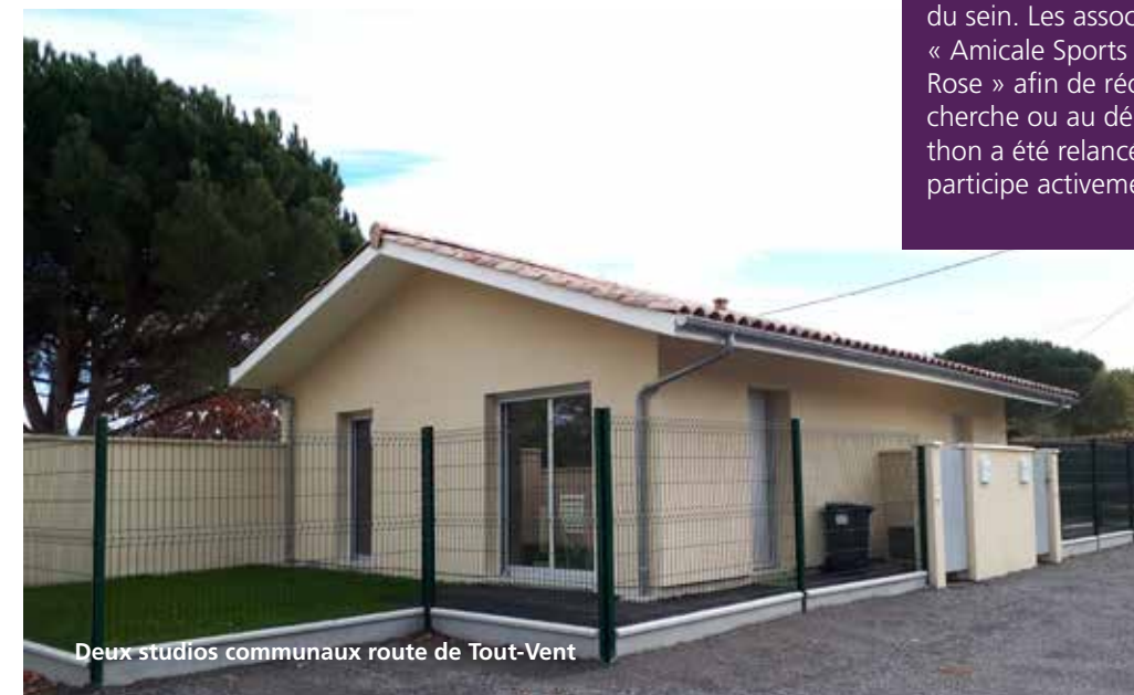
Deux studios communaux route de Tout-Vent

de la mairie. En cas de fortes chaleurs et de déclenchement par le Préfet du plan « Alerte Canicule », celles-ci pourront être contactées et, au besoin, une aide pourra leur être apportée. En fin d'année, pour les plus de 65 ans, sont organisés un déjeuner et une animation musicale. A cette occasion, sont mis à l'honneur une doyenne et un doyen. A la fin de 2018, pas moins de 200 convives étaient présents.