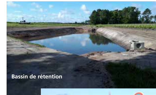
Bassin de rétention

*(Territoires Viticoles Respectueux de l'Environnement)