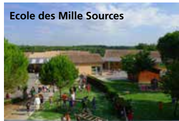
Ecole des Mille Sources

Afin de favoriser l'apprentissage et initier les enfants aux outils numériques et assurer l'égalité entre les élèves, toutes les classes élémentaires ont été équipées de tableaux interactifs. Depuis la rentrée 2018, une classe mobile informatique est