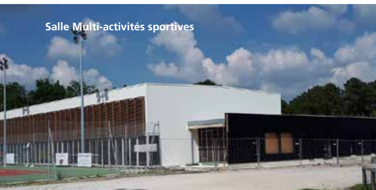
Salle Multi-activités sportives

En septembre sera livrée la nouvelle salle multi-activités sportives à la Plaine des Sports. Deux salles contiguës de 275m 2 dont l'une peut accueillir plusieurs associations sportives et l'autre le Dojo. Ces infrastructures serviront aux enfants pour l'accueil de loisirs (A.L.S.H) pendant les vacances scolaires.