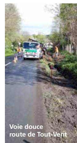
Voie douce route de Tout-Vent