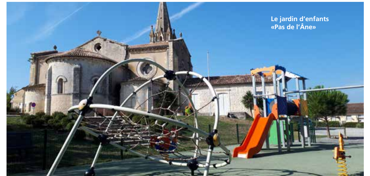
Le jardin d'enfants «Pas de l'Âne»