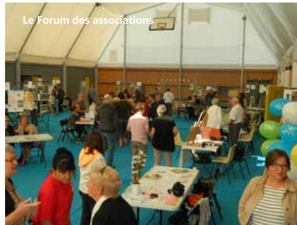
Le Forum des associations

Depuis 2014, de nombreux travaux ont été entrepris : des travaux d'étanchéité au DOJO, l'aménagement de l'espace traiteur à la salle Multisports, la création d'un éclairage au boulodrome, l'amélioration de celui du terrain de tennis et du stade, l'extension du local de la pétanque pour les animations ainsi que des sanitaires, l'installation d'un sol stratifié, la création d'un auvent au Club House du tennis, le réaménagement des douches et sanitaires au vestiaire du football et l'installation de la vidéo-surveillance au stade. Nous allons aussi bénéficier d'une salle multi-activités sportives et de l'agrandissement du parking de la Plaine des Sports avec une aire paysagée. Et nous avons renouvelé le matériel destiné aux manifestations avec l'achat de podiums et de chapiteaux.