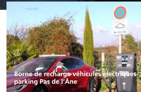
Borne de recharge véhicules électriques parking Pas de l'Âne