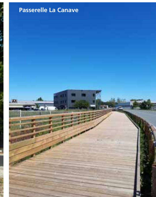
Passerelle La Canave