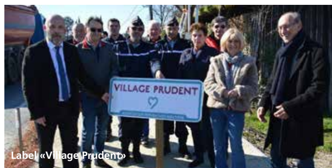
Label « Village Prudent »

Pour protéger nos enfants qui attendent le transport scolaire, des abribus ont vu le jour dans différents quartiers de la commune. La route de la Dîme et la route de Mondet ont été mises en sens unique après consultation des riverains. Depuis mars 2017, nous avons installé des dispositifs de surveillance dans certains lieux sensibles.