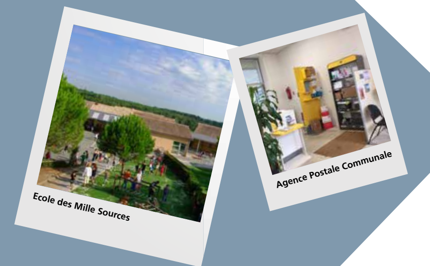
Ecole des Mille Sources