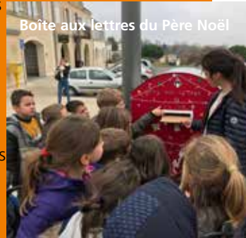
Boîte aux lettres du Père Noël