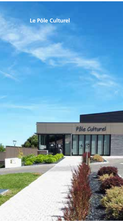
Le Pôle Culturel

Notre bourg s'est vu transformé avec l'aménagement d'un jardin d'enfants et d'un City-Stade. Vingt mois de travaux ont permis la naissance du Pôle Culturel et de la Médiathèque. La place Marcel Vayssière a été complètement rénovée ainsi que le pourtour de l'église. L'ancien presbytère a été complètement réhabilité afin de permettre aux Martillacais de louer les lieux pour des festivités, avec un espace traiteur. Notre patrimoine n'a pas été oublié, en effet, la restauration de l'abside de l'église de Notre-Dame a été effectuée. Depuis cinq ans, de nombreux travaux ont été entrepris afin de « relooker » notre mairie. L'accueil s'est vu agrandi afin d'accueillir l'Agence Postale Communale. Les murs ont été repeints intérieur comme extérieur, des portes ont été remplacées, tous les volets roulants motorisés, des pierres cassées sur la façade ont été changées. De nouveaux outils informatiques ont été installés. La salle servant aussi bien aux réunions du Conseil Municipal qu'aux mariages s'est vue entièrement rénovée, et de nouvelles tables et chaises y ont pris place.