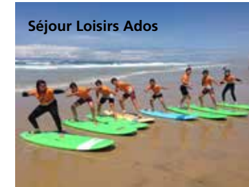
Séjour Loisirs Ados

L'été, un accueil sur la Plaine des Sports est organisé pour les élémentaires. Le service Loisirs Ados propose à nos jeunes des activités sportives et éducatives basées sur la découverte d'activités moins formalisées autour de sports à sensations et des journées d'animations. Pendant les vacances d'hiver et d'été, des séjours à la montagne et à l'océan sont proposés.