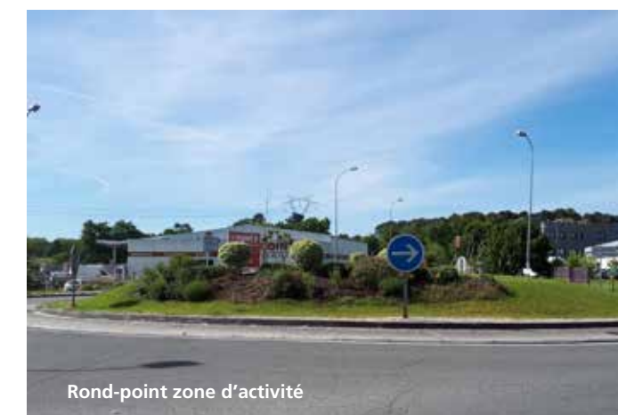
Rond-point zone d'activité