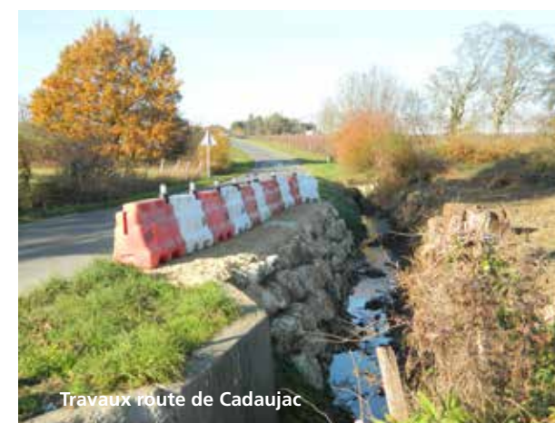
Travaux route de Cadaujac