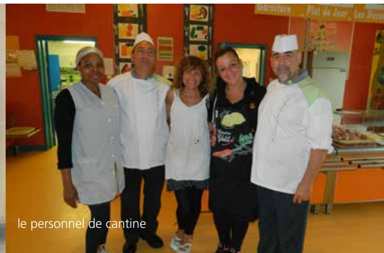
le personnel de cantine